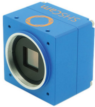
Wavefront sensor SHSLab UHR