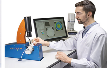
CL tester SHSOphthalmic omniSpect

Die Optocraft GmbH bietet ein umfangreiches Standardprogramm optischer Messtechnik für Optiken, optische Systeme und Laser. Zusätzlich entwickelt Optocraft Lösungen für kundenspezifische Messaufgaben.