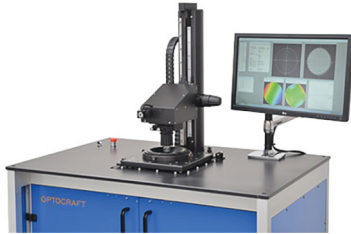
Optics tester SHSInspect 2Xpass